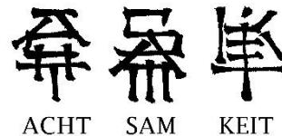
ACHT SAM KEIT