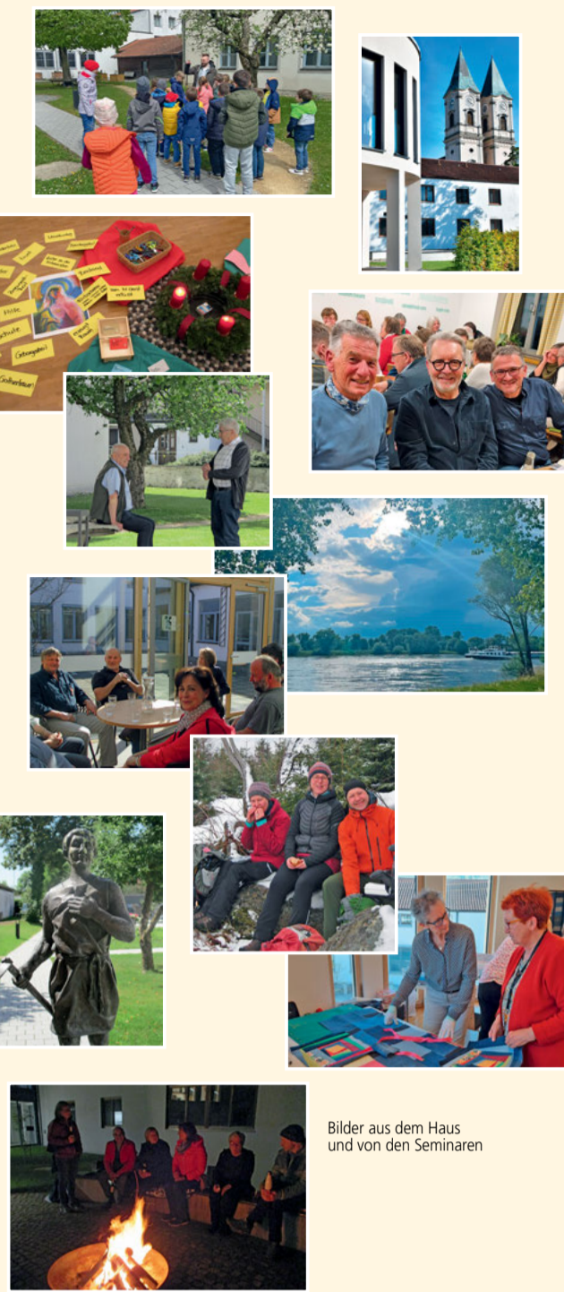
Bilder aus dem Haus und von den Seminaren

Nähere Informationen zu den Pilgerwanderungen und zur Assisfahrt finden Sie auf unserer Homepage.